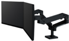
Brazo dual LX Pro