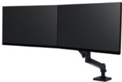
LX Pro Dual Directo