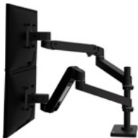
Brazo para dos monitores apilados LX Pro