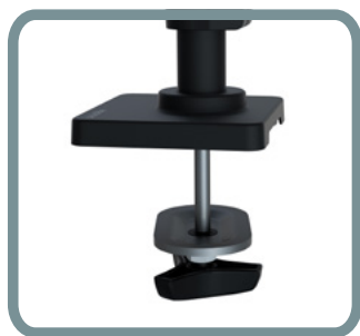
MONTURA DE OJAL #98-728