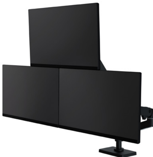
AÑADA UN BRAZO CON EL KIT BRAZO ADICIONAL (DE DOS A TRES O CUATRO) *SOLO PARA POSTE ALTO N.º 98-734