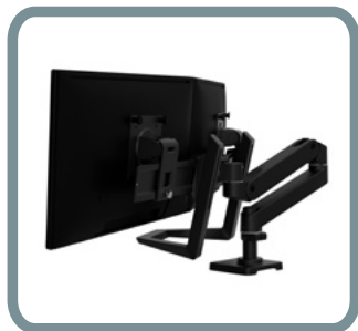
KIT DE ASA *SOLO PARA DUAL DIRECTO N.º 98-037