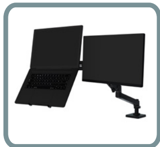
BANDEJA PARA PORTÁTIL N.º 50-193-200